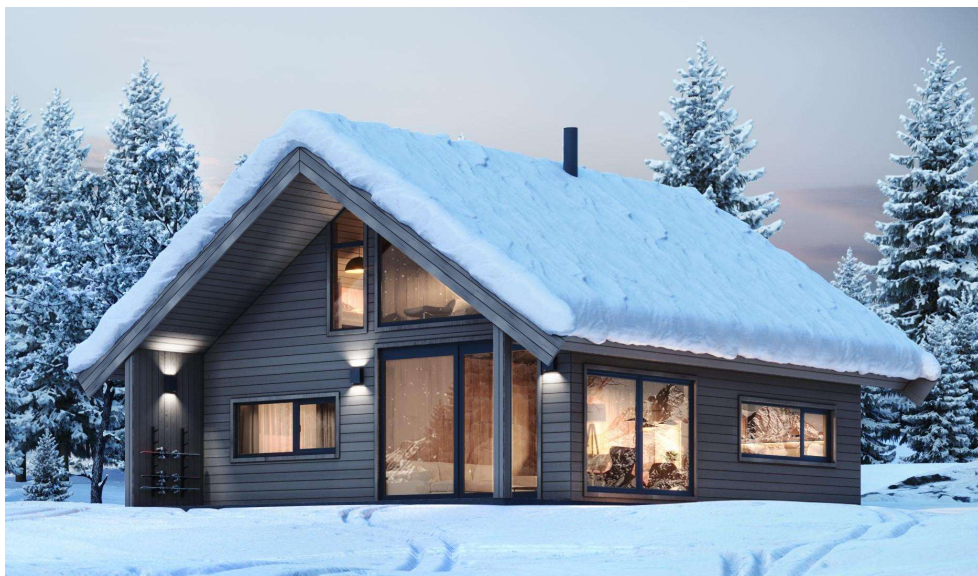
Illustrasjonen er veiledende. Det vil være mindre avvik fra illustrasjonen på noen av modellene til hytteserien. Se fasadetegningen for eksakt utsende på hver enkelt hyttemodell.